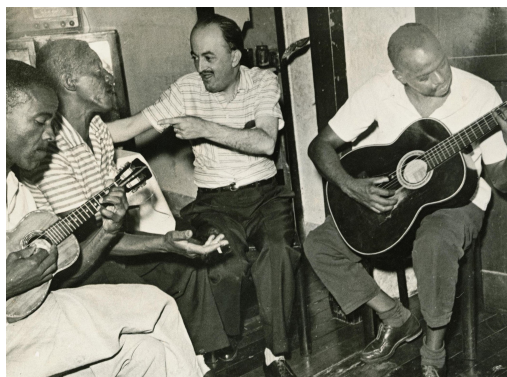
07. Cartola e Lamartine Babo, década de 1960