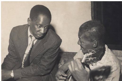
09. Jamelão e Cartola, s.d.