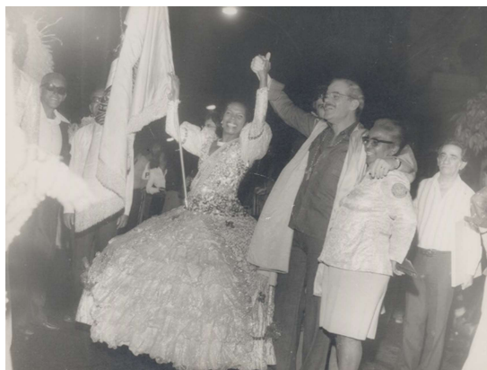
022. Dona Zica e Cartola durante desfile da Mangueira.