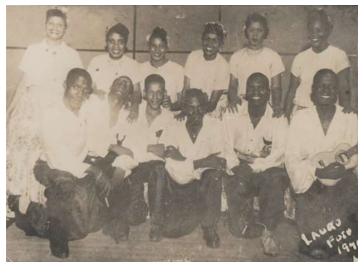
021. Grupo Carioca com Cartola, Heitor dos Prazeres e Paulo da Portela, 1941.