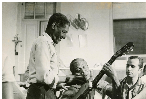
06. Cartola e Nelson Cavaquinho, década de 1960