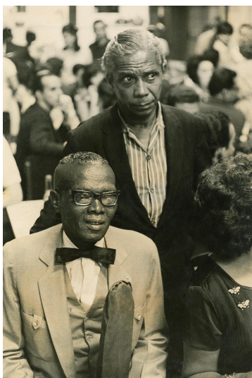
013. Heitor dos Prazeres e Nelson Cavaquinho, década de 1960.