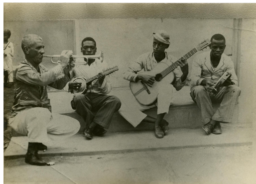
010. Cartola e sambistas da Mangueira, s.d.