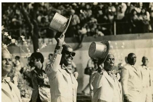
05. Cartola e Nelson Cavaquinho, década de 1970