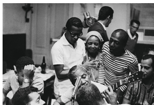
08. Cartola e sambistas, década de 1960