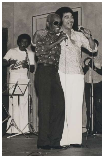
019. Cartola e João Nogueira.