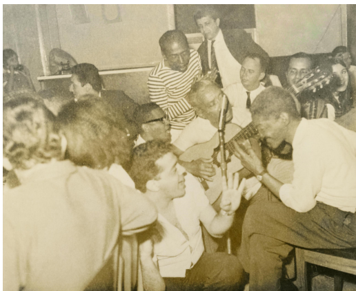
011. Cartola e sambistas, década de 1960.