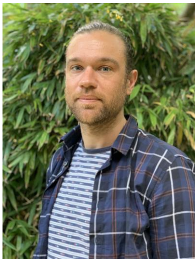
03. Kalev Erickson (Archive of Modern Conflict)