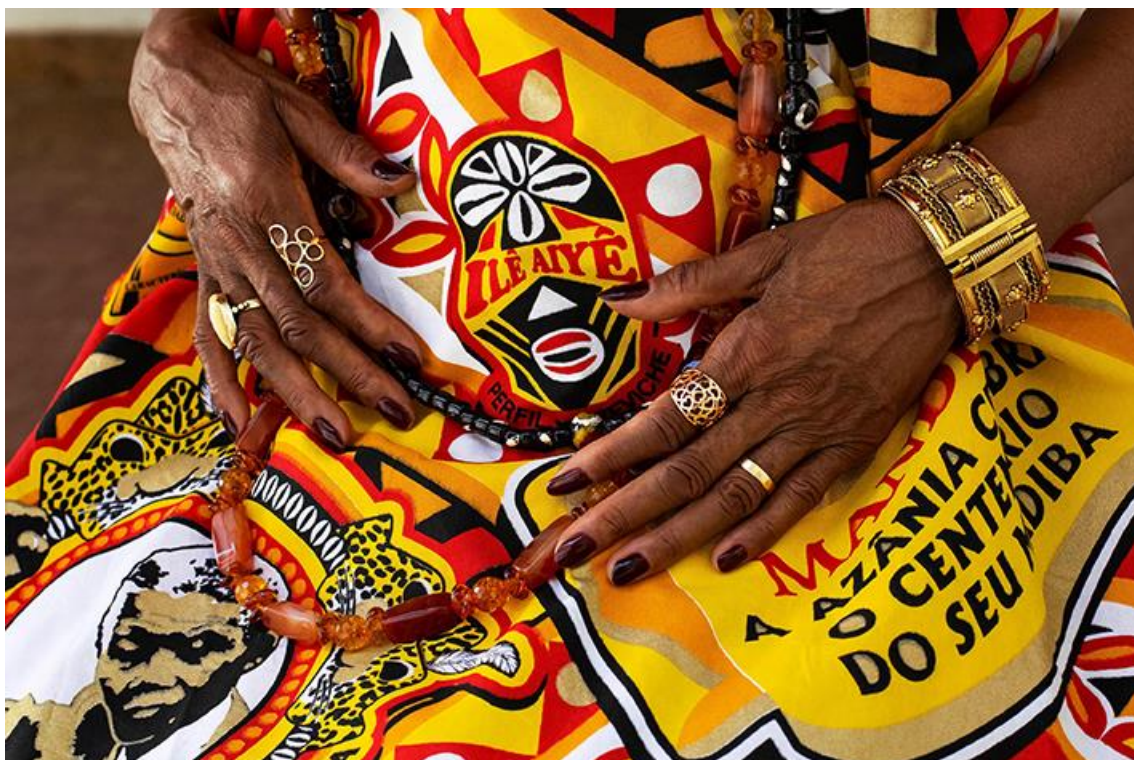
015. Dete Lima com detalhe de tecido Ilê Aiyê 2018