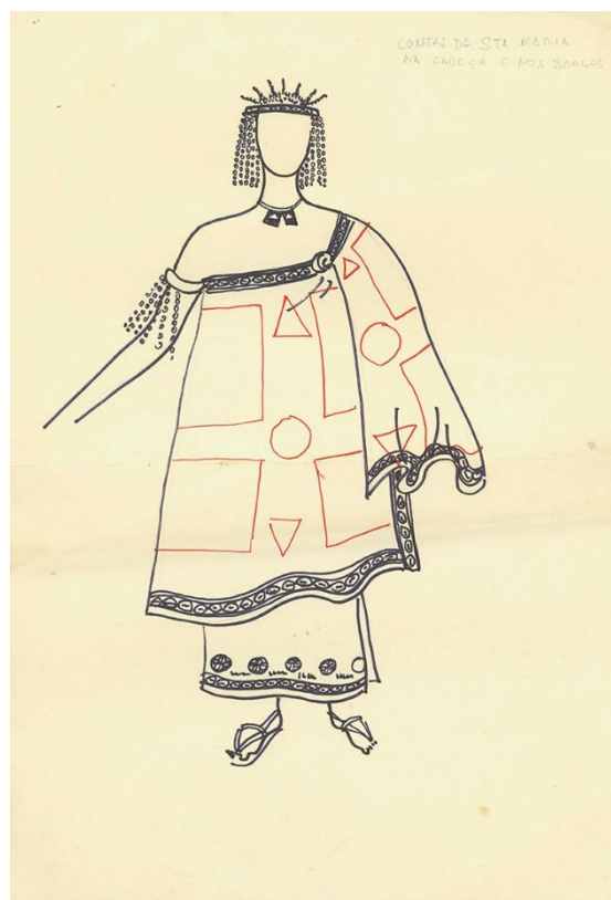
026. Croqui de fantasia, desenhado por J. Cunha