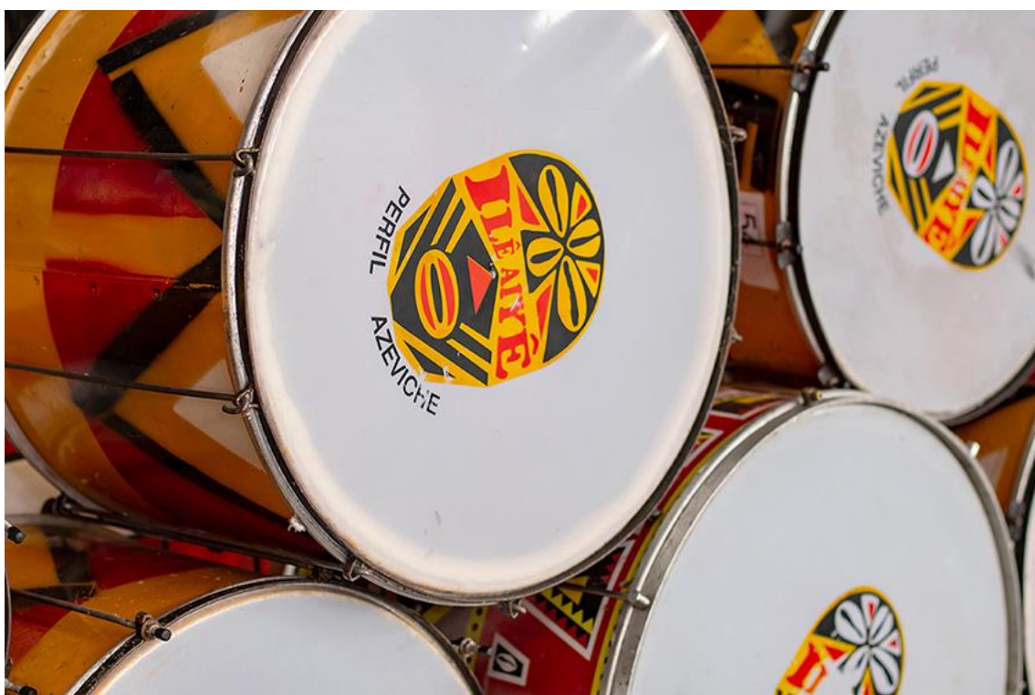
022. Detalhes dos tambores Ilê Aiyê