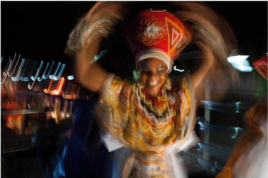
019 e 020. Dançarinas do Ilê Aiyê, Carnaval de 2018