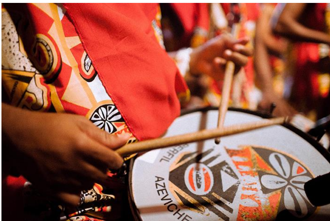
016. Detalhe do Carnaval 2018