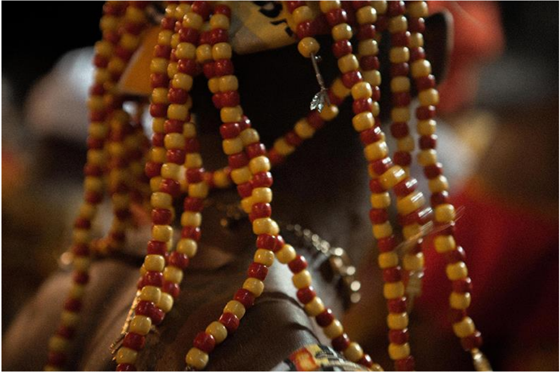
017. Detalhe do Carnaval 2018