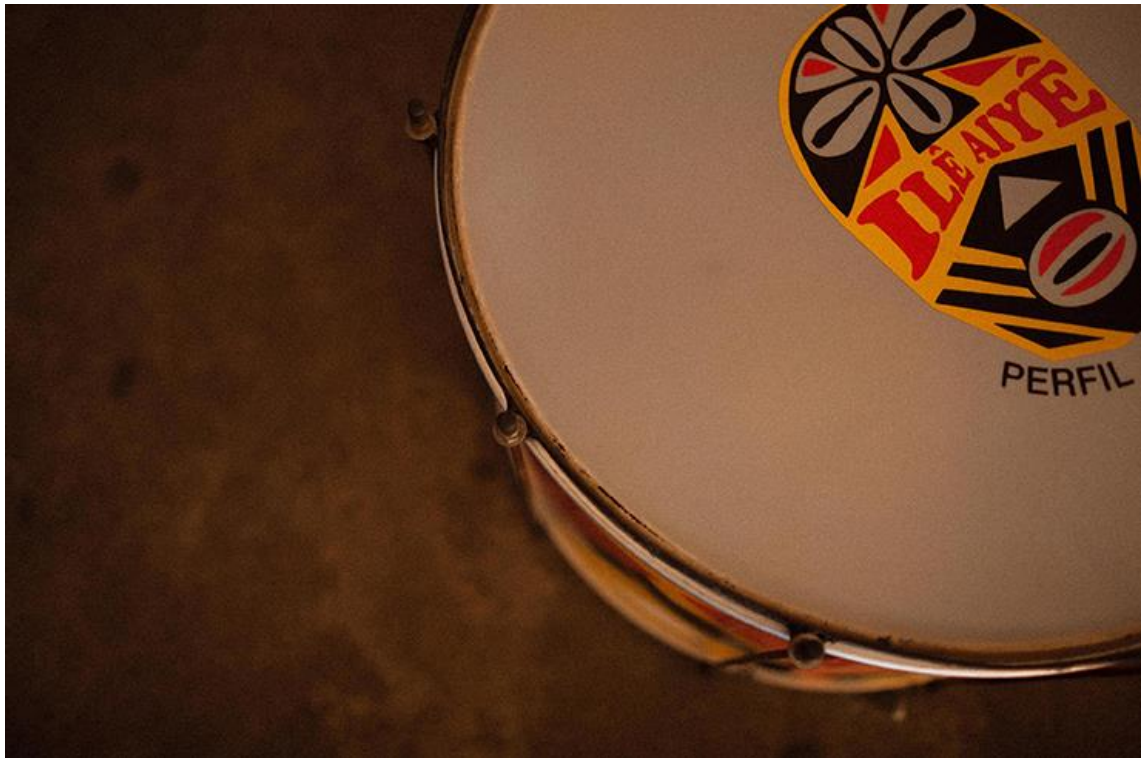
023. Detalhe de tambor do Ilê Aiyê